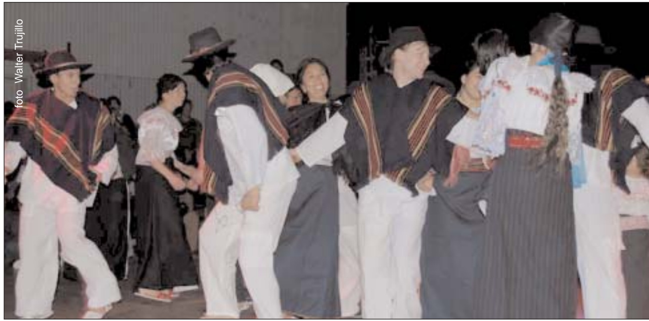
El grupo de baile folclórico ecuatoriano alemán, Tani Tani

Presentes autoridades ecuatorianas, numeroso público y el folklor del grupo Tani Tani