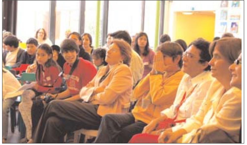
Representantes del Banco del Libro escuchan las preguntas que los niños les dirigen.