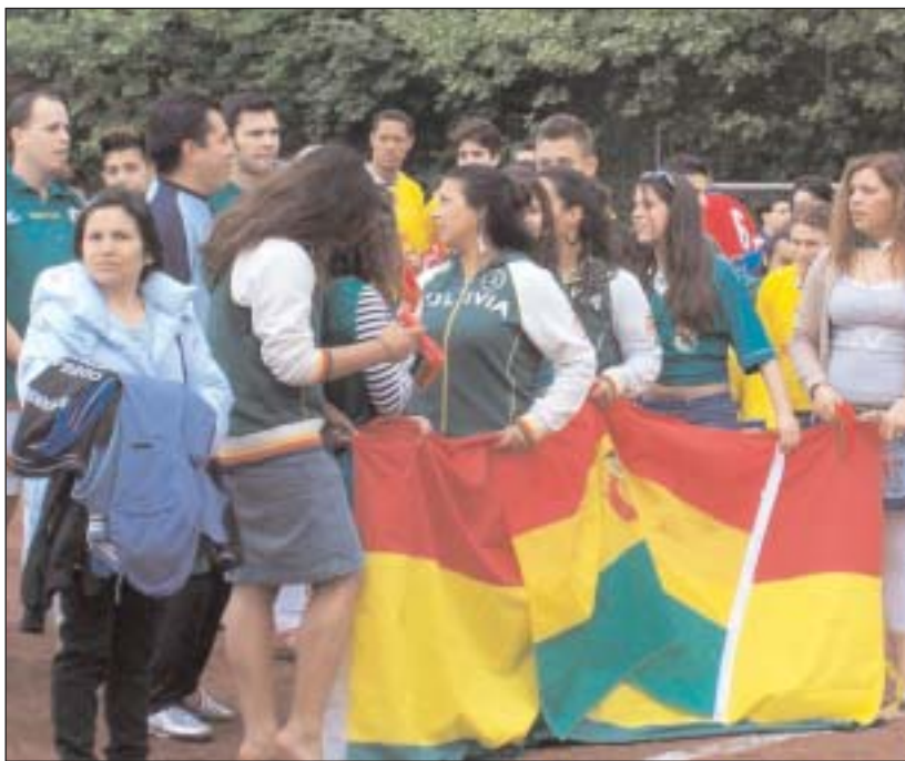
Los hinchas del equipo boliviano