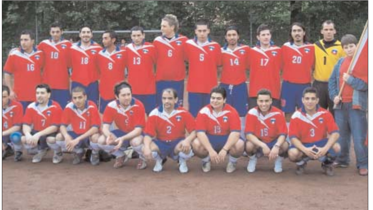
Equipo de Chile

En Alemania, el anual Torneo Sudamericano de Fútbol