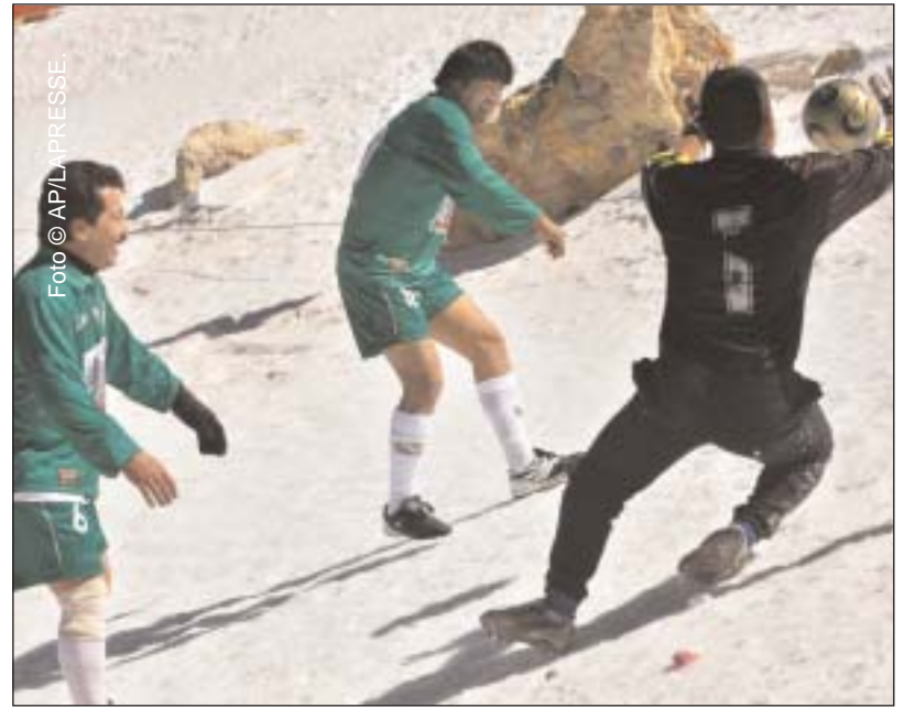
El presidente Morales juega un partido a más de 5000 metros

La manifestación encabezada por el embajador de Bolivia en Italia, Esteban Elmer Catarina, se desarrolló