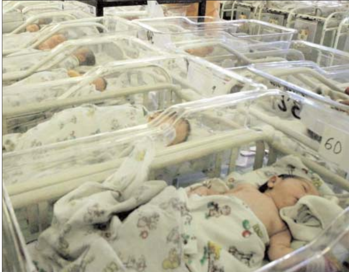
La inmigración da un aporte fundamental a la natalidad en España