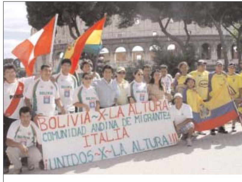
A los pies del Coliseo, en Roma, protesta contra la decisión de la FIFA

pecto a la prohibición. "UNASUR exhorta al Comité Ejecutivo de la FIFA, que en su reunión del próximo día 27 de junio, dé consideración favorable a la solicitud unánime contenida en la misiva de 15 de junio de la Confederación Sudamericana de Fútbol (CONMEBOL), y a la recomendación de la OEA (AG/DEC 56) para dejar sin efecto la resolución", indicó el comunicado de la Unión de Naciones Suramericanas.