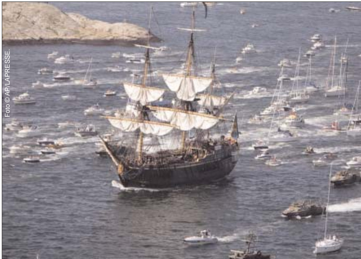
El retorno de una réplica del barco Gotheborg desde China. En 1732, un barco mercante de la Compañía Sueca East India zarpó de Goteborg hacia Guangzhou, inaugurando el comercio de Suecia con China.1

"Lo fundamental es tener las mismas reglas en toda la Unión, para que