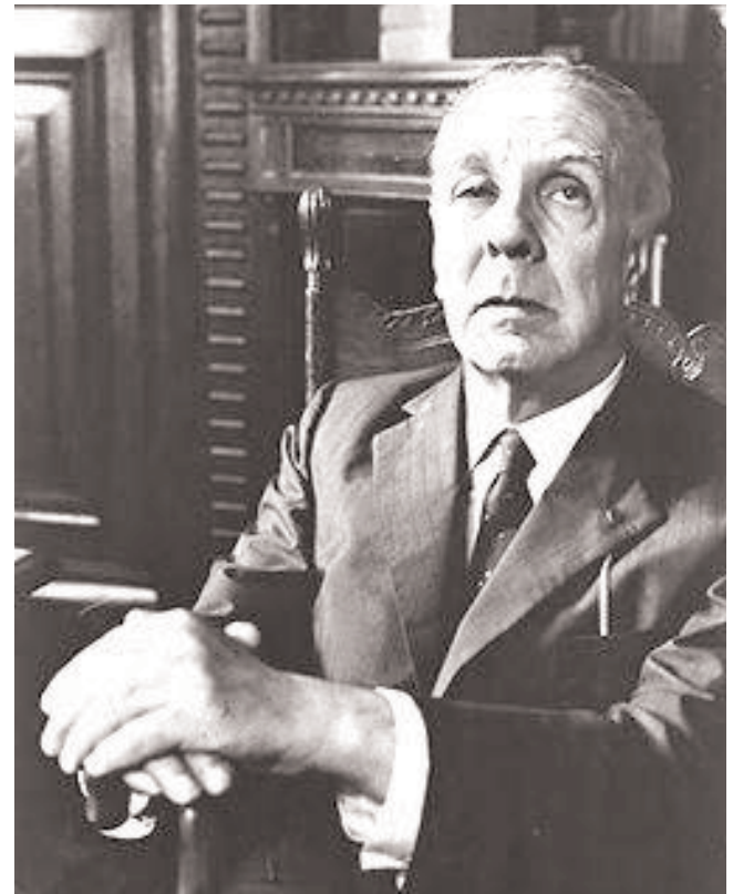
Jorge Luis Borges (Buenos Aires, El 24 de agosto de 1899, - Ginebra, 14 de junio de 1986) Escritor argentino y una de las glorias de las letras en idioma español, así como figura literaria del siglo XX. Su obra consiste en cuentos, ensayos y poesía.

Todas las acciones son organizadas y coordinadas por el Ministerio de Cultura y la Subsecretaría de Relaciones Internacionales del Gobierno de la Ciudad, el Ministerio de Relaciones Exteriores y Culto (por medio de su Embajada en Praga), la Fundación Jorge Luis Borges y el Centro Frank Kafka, con asiento en la capital