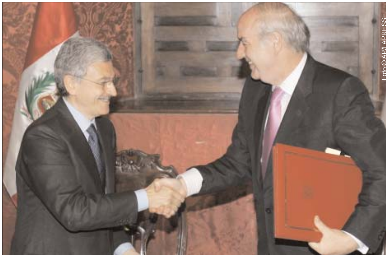
García Belaúnde, ministro de exteriores del Perú con su par italiano Máximo D'Alema a inicios del 2007. En la ocasión ya anticipó la intención de Perú de lograr un tratado de libre comercio con la UE

El canciller peruano dijo que Amado se comprometió a asegurar el éxito de la Cumbre América Latina-UE, que se celebrará en Lima en mayo del 2008. García Belaúnde le transmitió a Amado su preocupación sobre la necesidad de ayuda para tener una "buena agenda y buenos resultados" en la cita de la capital peruana, que tiene como objetivo "ir al encuentro de las necesidades de los pueblos". García Belaúnde le transmitió a