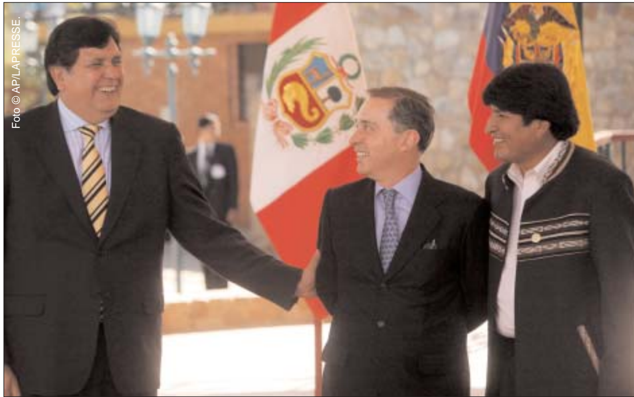
Los presidentes Alan García del Perú, Alvaro Uribe de Colombia y Evo Morales de Bolivia durante la cumbre

El presidente peruano, Alan García, agradeció el empeño de Bolivia que permitirá comenzar de inmediato la negociación de un trato comercial entre la CAN y la UE. "El sacrificio hecho por Bolivia es una muestra fraterna de voluntad integracionista que todos los