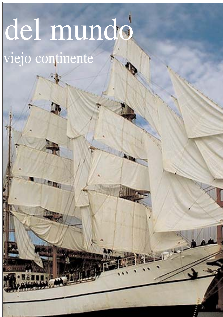
El buque escuela Guayas entrando al puerto de San Francisco en Estados Unidos