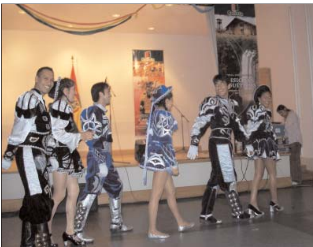
Uno de los grupos de bailarines participantes

Lluvias torrenciales golpearon al país andino