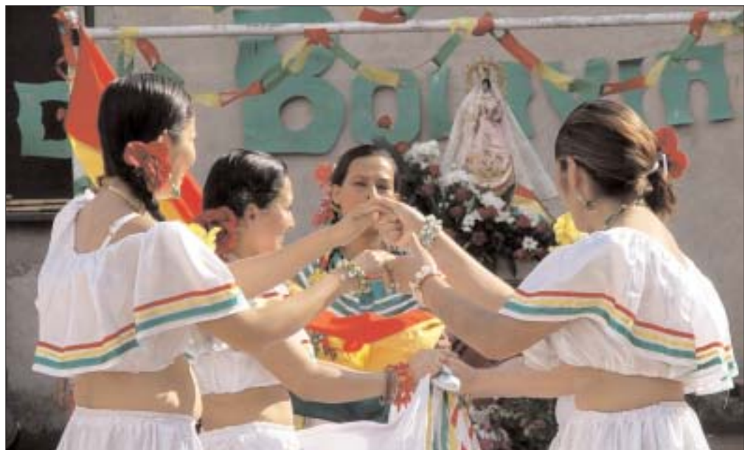
Procesión y folklor en el centro de la festividad popular boliviana

Devoción, culinaria y folklore en la fiesta romana de la patrona de Bolivia