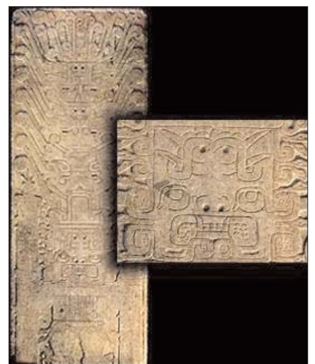
Original al Museo Nacional de Antropología

Luego que el templo fue abandonado este monumento sobrevivió a la destrucción del tiempo y a los saqueadores ("huaqueros") de tesoros, hasta llegar a casa de una humilde familia de campesinos de la localidad de Chavín, que la usaban como tablero de mesa, es en esa