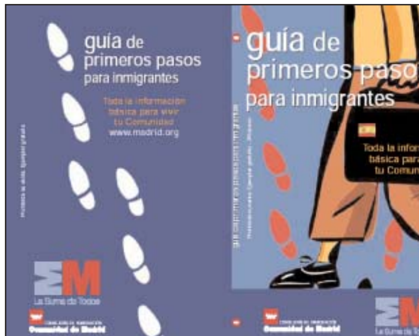
La Guía de primeros pasos, editada por la Comunidad de Madrid

Para el recién llegado, el conocimiento de la realidad con la que se encuentra es fundamental para desarrollar la nueva etapa de su nueva vida. Con esta guía de información útil, en forma de manual, se le facilita un camino de integración.