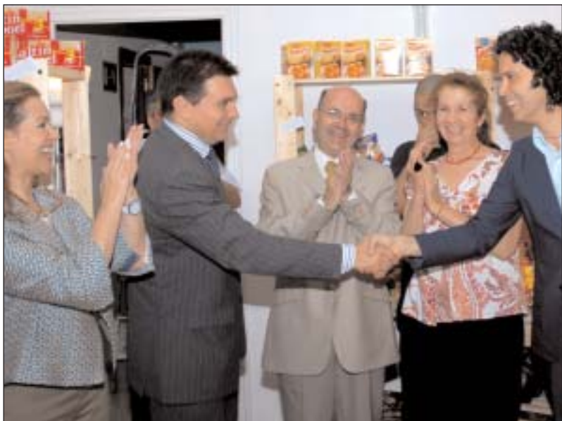
Cordialidad y aplausos durante el evento

Las asociaciones Candelita y Aculco abrieron en Madrid una tienda solidaria de cooperación al desarrollo con mujeres de Colombia. A la inaugura-